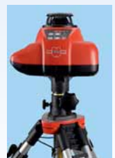
Anwendung auf Kurbelstativ