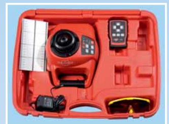
Alles griffbereit im robusten Kunststoff-Koffer