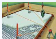
Nivellierarbeiten von Decken- und Bodenplatten