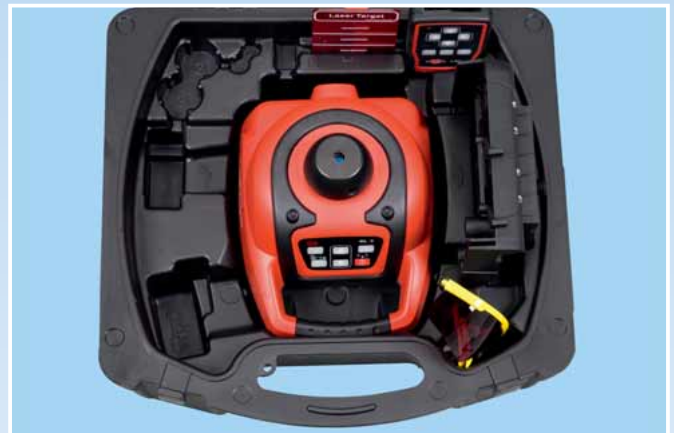
Alles griffbereit im robusten Kunststoff-Koffer