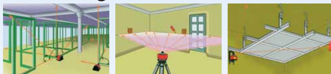
Ausrichten von Zwischenwänden