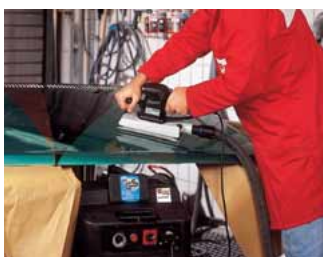
Lackschleifen mit dem Industrie-Staubsauger ISS 45-M mit Zulassung Staubklasse M.

Schleifen von Holz, Kunststoff, NE-Metall, Stahlblech ... Gespachtelte und lackierte Flächen, ebene und gewölbte Flächen.