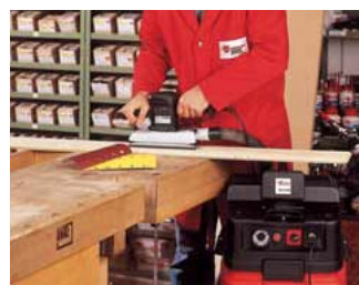
Holzschleifen mit dem Industrie-Staubsauger ISS 45-M mit Zulassung Staubklasse M.