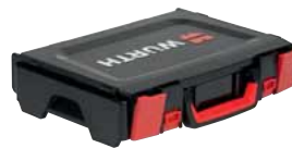
Verschlüsse mit Griffmulden