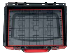
Viel Platz dank homogener Innenfläche