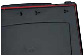
Umlaufende rote Elastomerdichtung