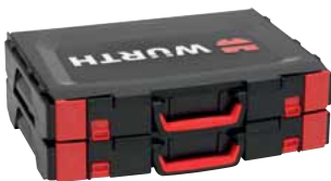
Verbinden mehrerer Koffer