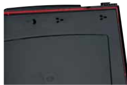
Umlaufende rote Elastomerdichtung