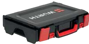
Verschlüsse mit Griffmulden