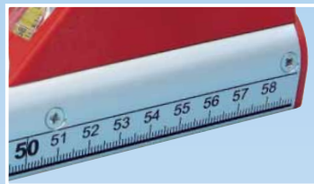
Skalierung auf Gehäuse