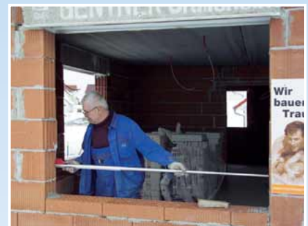
Zur horizontalen Messung