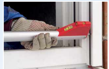
Zum Messen in Rollladenführungen