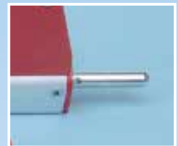
Beide Enden mit Messdornen ausgerüstet