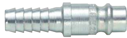
Stecknippel Serie 2000 mit Schlauchanschluss für Würth PVC- und Lackierschläuche