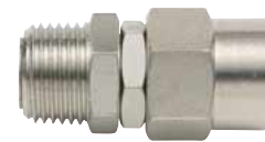
Stecktülle Serie 2000 drehbar, mit Komfortanschluss für Würth PU-Schläuche, Außengewinde