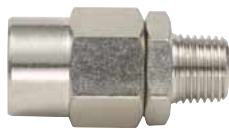
Stecktülle Serie 2000 mit Komfortanschluss für Würth PU-Schläuche, Außengewinde