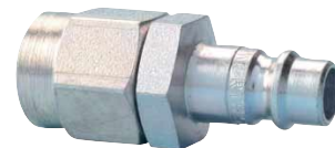
Stecknippel Serie 2000 mit Komfortanschluss für Würth PU-Schläuche