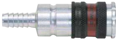
Schnellverschlusskupplung Serie 2000 mit Schlauchanschluss für Würth PVC- und Lackierschläuche