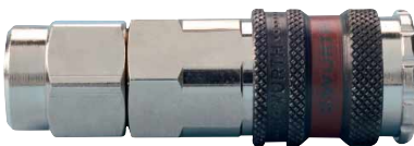
Schnellverschlusskupplung Serie 2000 mit Komfortanschluss für Würth PU-Schläuche