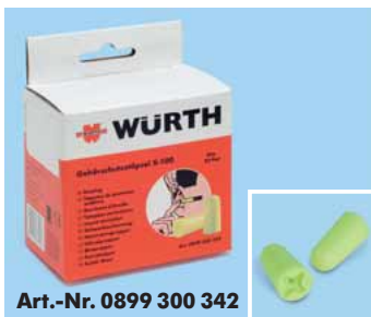
Art.-Nr. 0899 300 342

* Bei allen Gehörschutzstöpseln x-100 und x-200. (Abb. 1 und 2)