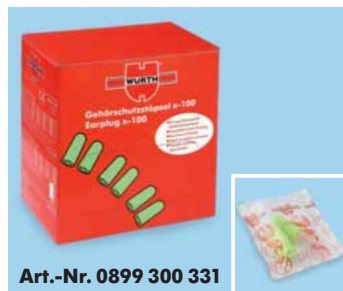
Art.-Nr. 0899 300 331